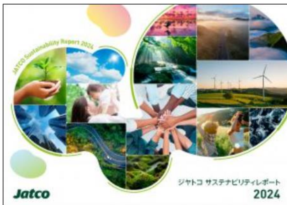
「ジャトコ サステナビリティレポート2024」

social, and economic initiatives, we will revamp the structure of our "Environmental and Social Report," which we have published annually since 2009, and publish it as a "Sustainability Report."